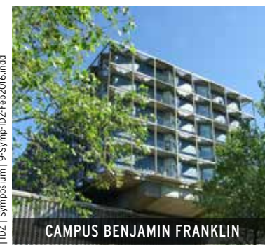
CAMPUS BENJAMIN FRANKLIN

INTERDISZIPLINÄRES DARMKREBSZENTRUM | IDZ