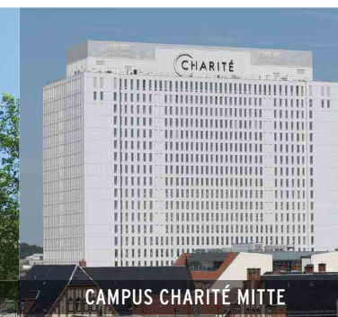
CAMPUS CHARITÉ MITTE