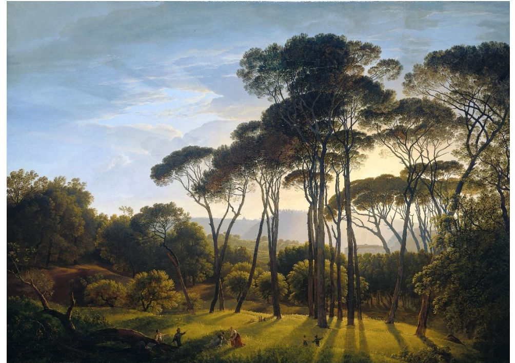
Hendrik Voogd - Italiaans landschap met parasoldennen

W. A. Mozart – 29. Sinfonie in A-Dur, KV 201 F. Schubert – 5. Sinfonie in B-Dur, D 485