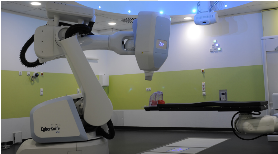
CyberKnife: Fokussierte, hochenergetische Röntgenstrahlen aus 300 bis 400 Einstrahlrichtungen zerstören das Tumorgewebe.

Kurz, schmerzfrei und hoch effektiv ist die Krebsbehandlung mit dem CyberKnife. Seit letztem Jahr ist die Präzisionsbestrahlung auch an der Charité möglich.